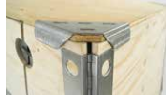
Deckel mit Winkeln