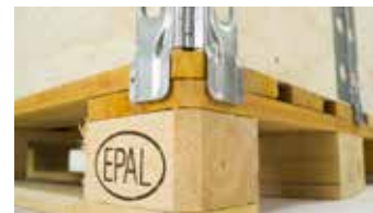
Auflage auf Palette