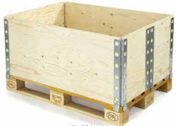
Viko 6 Scharniere

Die Viko-Kisten ermöglicht eine umfangreiche Personalisierung mit: Innenraumabtrennungen, Formplatten, Aufdrucken, Tragelementen, Griffen, Keilen, Verriegelungslaschen und Abstandhaltern.