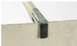
Haken für Innenraumabtrennungen