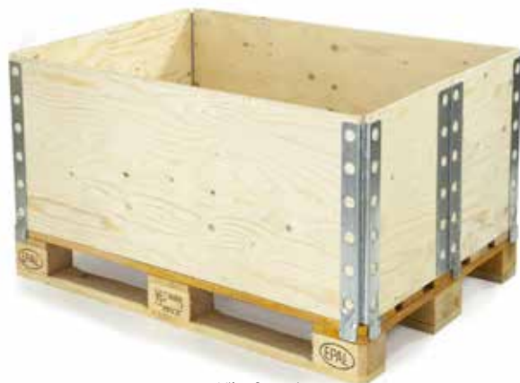
Viko 6 cerniere

La cassa Viko è predisposta per una ampia personalizzazione con: divisori interni, fogli sagomati personalizzati, stampe, selle, maniglie, cunei ganci e distanziali.