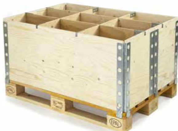
Viko con separatori interni