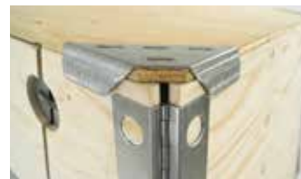
Coperchio con angoli