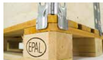
Appoggio sul fondo