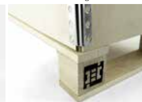
Seitenwand gleich Palette 4-Weg