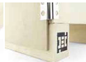
Seitenwand, die auf Träger absinkt 2-Weg