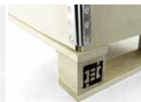
Laterale pari al fondo 4 vie