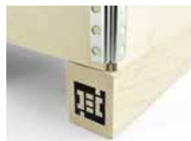
Panneau latéral identique à la traverse 2 entrées