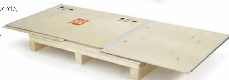
Caisse à plat