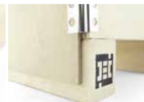
Panneau latéral qui s'appuie sur la traverse 2 entrées