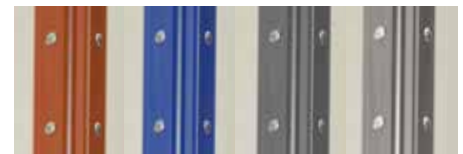
In verschiedenen Farben personalisierbarer Winkel