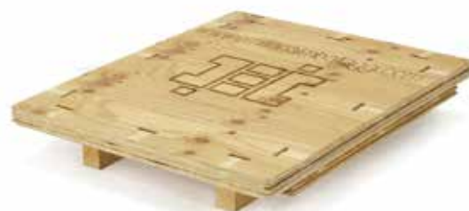
Caisse à plat