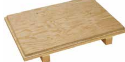
Fond à deux entrées