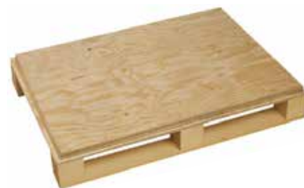
Fond à quatre entrées