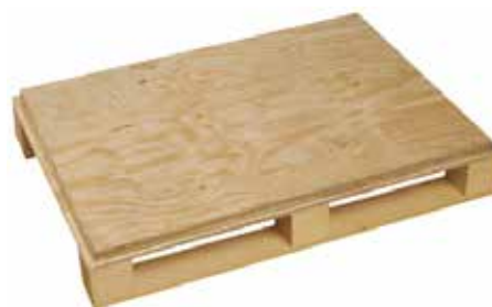
Fondo a quattro vie in compensato multistrato