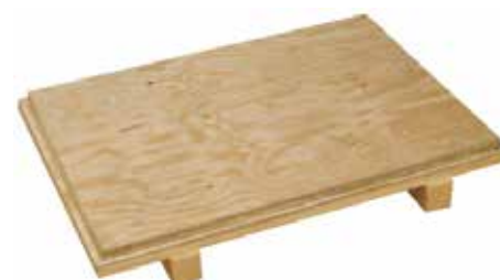
Fondo a due vie in compensato multistrato